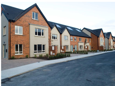
Tithíocht Shóisialta arna fháil ag Cúirt Rossan, Baile Átha Cliath in 15

Le linn 2015 cuireadh 368 n-aonad tithíocht sóisialta ar fáil faoi Chláir Tithíochta don soláthar díreach, Scéim um Chóiríocht ar Cíos, Léasú Fadtéarmach, Scéim Cúnaimh Caipítíl agus Éadálacha Chuid V agus tabhairt ar ais áitreabh folamh le linn na tréimhse.