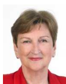
Eithne Loftus, Fine Gael