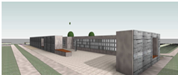
Ballaí Colmlainne Reilig Bhaile Ghrifín

Cuireadh tús le toiliú Chuid XI in 2015.