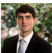
Jack Chambers Fianna Fáil