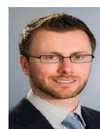
Roderic O'Gorman, An Comhaontas Glas