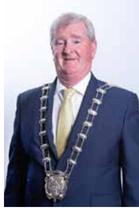
Leasmhéara Tom Kitt Fianna Fáil