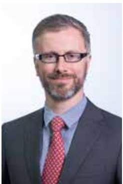
Roderic O’Gorman, Green Party/An Comhaontas Glas