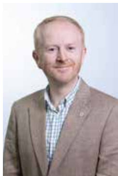
David Healy, Green Party/An Comhaontas Glas