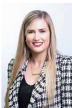
Aoibhinn Tormey, Fine Gael