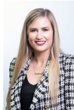
Aoibhinn Tormey, Fine Gael