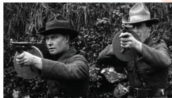
An IRA ag cleachtadh le meaisínghunnaí Thompson, 1921