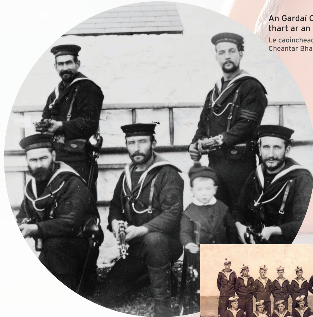
An Gardaí Cósta, Baile Brigín, thart ar an mbliain 1890