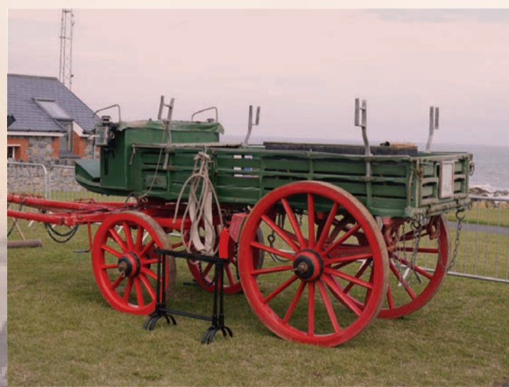
Cairt Roicéad Na Sceirí Le caoinchead ó Garda Cósta na hÉireann, Na Sceirí Is gaireas tarrthála an Chairt Roicéad. Úsáidtear roicéad chun téad éadrom a scaoil ar long i nguais. Úsáidtear an téad sin chun trealamh agus téada níos troime a tharraingt ar bord an long. Bhí soláthair gaireas tarrthála sa Chairt Roicéad agus de ghnáth is cairt capaill a bhí ann. Tá Cairt Roicéad Na Sceirí ar iasacht faoi láthair do Comhairle Contae Fhine Gall.

Le linn Cogadh na Saoirse (1919-1921), scriosadh cuid mhór de na stáisiúin Garda Cósta. Bhíothas den tuairim go raibh siad mar chuid d'údaras na Breataine, agus ar an mbonn sin targaidí dlísteanaicha a bhí iontu. Bogadh na Gardaí Cósta agus a dteaghlaigh ar ais chun na Breataine. Tar éis shíniú an Chonartha Angla-Éireannaigh ag deireadh na bliana 1921, tháinig an Garda Cósta agus 109 stáisiún faoi sheilbh Shaorstát na hÉireann, agus ainmníodh an tSeirbhís Tarrthála Cósta air. Níor atógadh cuid mhór de na stáisiúin toisc go ndearnadh an-damáiste dóibh, agus aistríodh cuid eile ina dtithe príobháideacha. Sna blianta ina dhiaidh sin, tháinig go leor athruithe ar ainm na seirbhíse - An tSeirbhís Tarrthála Cósta agus Aille agus Seirbhís Éigeandála Muirí na hÉireann - sular athraíodh an t-ainm go dtí Garda Cósta na hÉireann sa bhliain 2009.