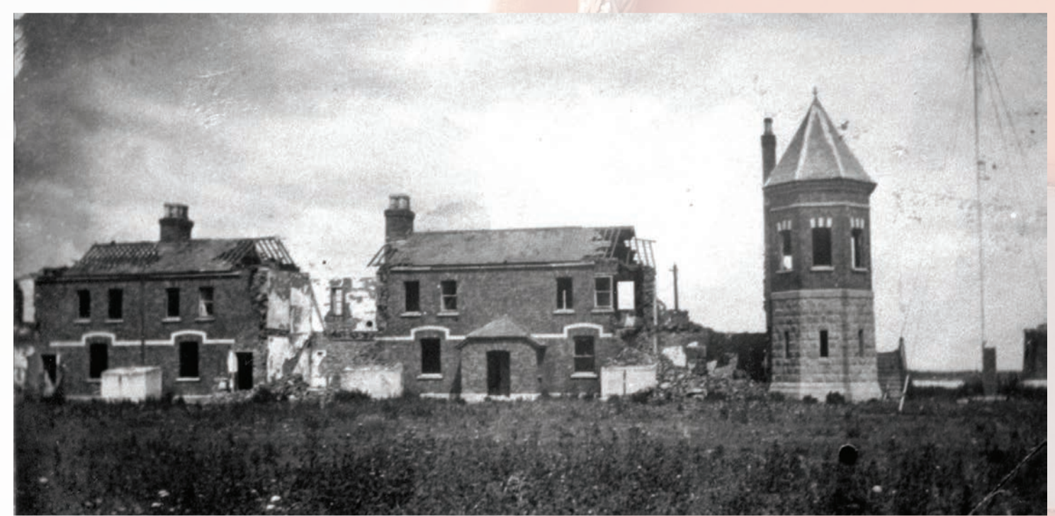
Fothrach an Stáisiún Garda Cósta Bhaile Brigín 1923

Evening Herald, an 18 Meitheamh 1921