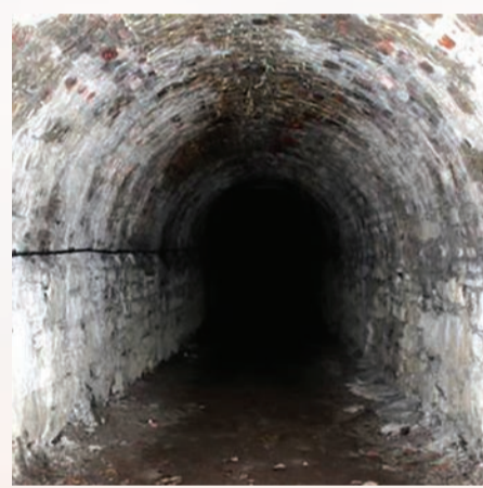
Tollán ag an Casino, Marino Le caoinchead ó Oifig na nOibreacha Poiblí