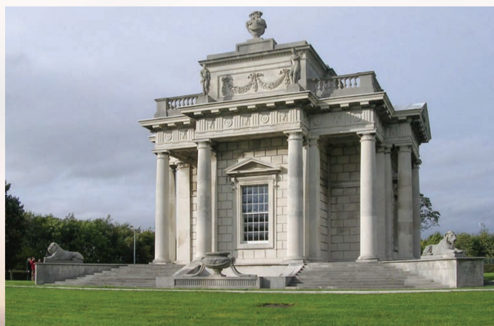
An Casino, Marino

Faoi mhí Bealtaine 1921, bhí líon beag gunnaí tar éis a mbealach a dhéanamh go hÉirinn, mar aon le beirt iar-oifigigh ó arm na Stát Aontaithe a thug oiliúint do bhaill Óglaigh na hÉireann maidir le conas iad a úsáid. Trialadh na gunnaí iad don chéad uair sa tollán faoin Casaíne i Marino, agus dream beag ar leith Óglach i láthair, Micheál Ó Coileáin agus Richard Mulcahy ina measc. Baineadh úsáid astu i gcomhrac don chéad uair ar an 16 Meitheamh 1921, nuair a rinneadh luíochán roimh thraen ina raibh trúpaí de chuid na Breataine á n-iompar ag stáisiún Dhrom Conrach. Gortaíodh triúir saighdiúirí agus dúradh sna nuachtáin go raibh na carráistí traenach "fágtha ina ribíní".