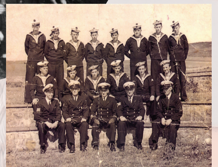
An Garda Cósta, Binn Éadair, thart ar an mbliain 1910