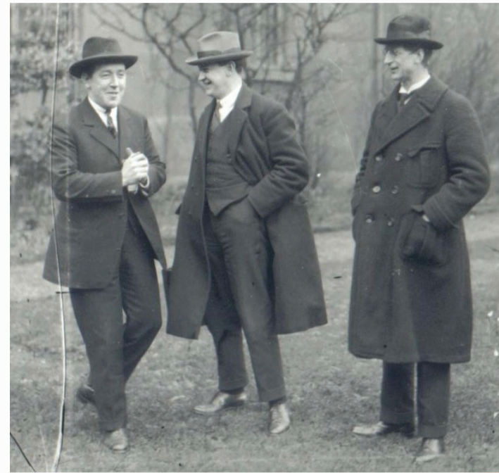
Anraí Ó Beoláin, Micheál Ó Coileáin agus Éamon de Valera