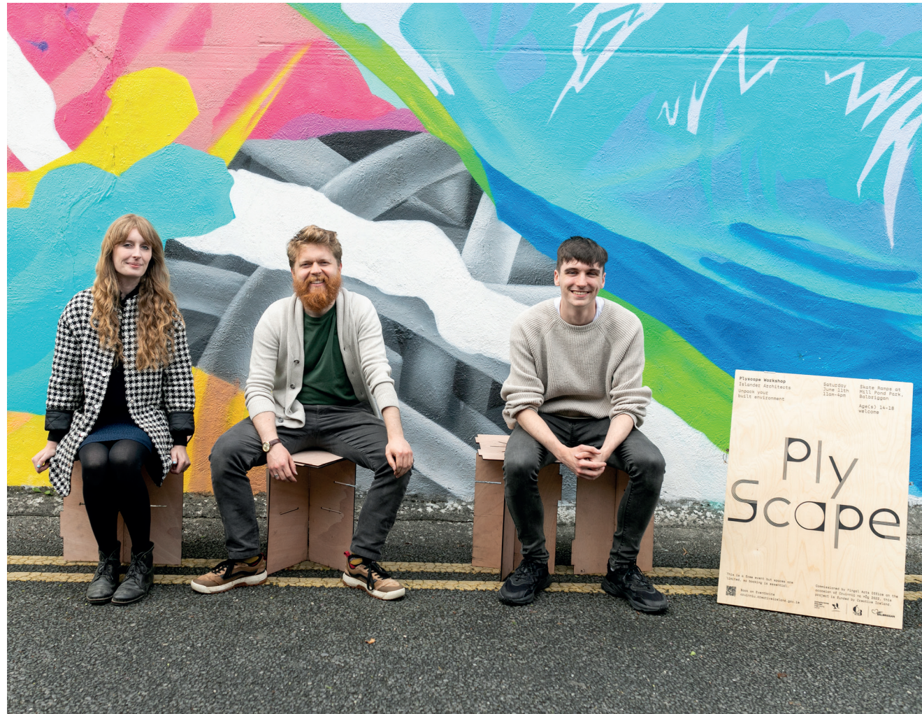
Plyscape Balbriggan architecture