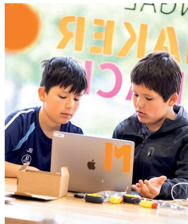
Design a buggy with the Fingalmaker.