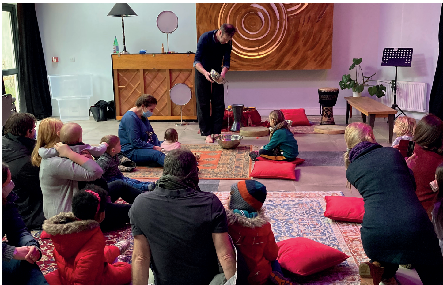
Grasshoppers Early Years Festival.