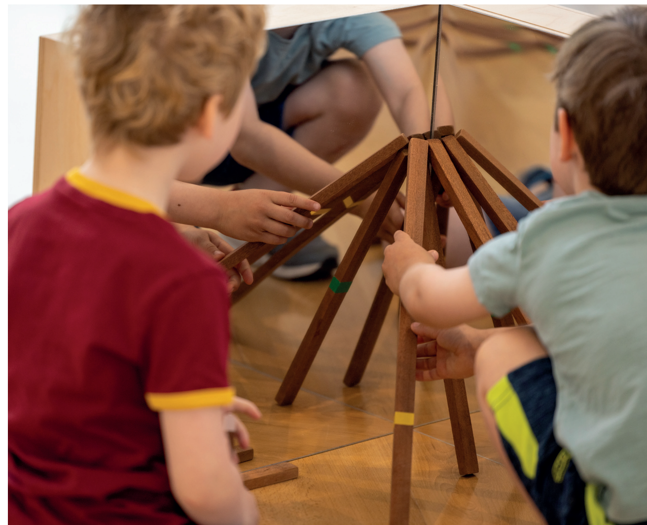
Make space at Draiocht.

Tá sé mar aidhm ag an bhfís straitéiseach atá i nDréachtphlean Forbartha Chontae Fine Gall 2023–2029: