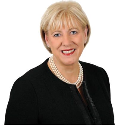
an T.D. Heather Humphreys

Tá ár leabharlanna poiblí i gcroílár ár bpobal. Cuireann leabharlanna réimse ollmhór seirbhísí ar fáil, i bpearsa agus ar líne, d'úsáideoirí leabharlainne, idir óg agus aosta. I mo cháil mar Aire Forbartha Tuaithe agus Pobail, ba thosaíocht ríthábhachtach domsa tacú le leabharlanna. Cúis áthais dom mar sin fáilte a chur roimh an straitéis nua seo de chuid na leabharlann poiblí í an Leabharlann an Áit: Eolas, Caitheamh aimsire, Inspioráid , ina leagtar amach 66 ghníomh straitéiseacha faoi 9 gcuspóir straitéiseacha agus 3 áisitheoir straitéiseacha dár leabharlanna poiblí, as seo go ceann cúig bliana.